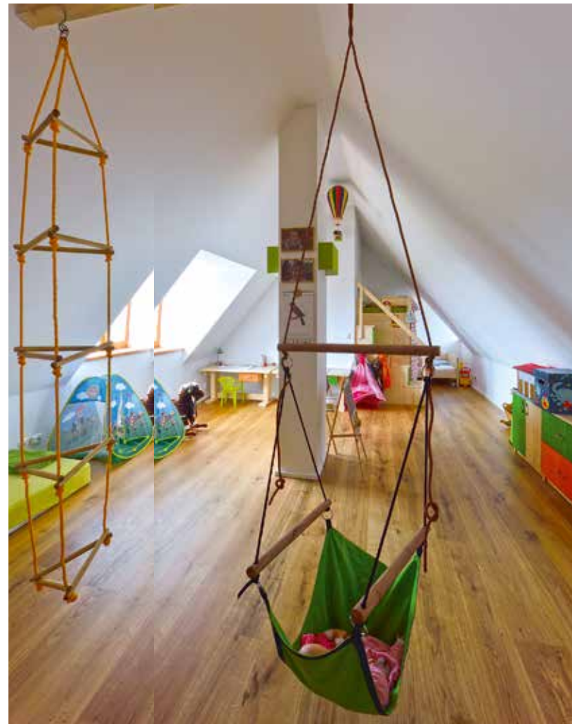
| Dětský pokoj v podkroví

Rozložením místností dům volně navazujeme na tradiční trojdělení úzkého a dlouhého venkovského stavení se vstupem ze dvora