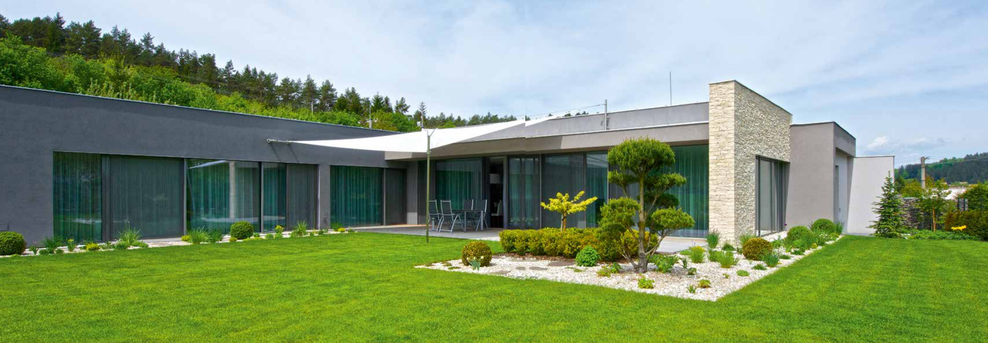
Dům má tvar písmene L, rameno s nejkrásnější vyhlídkou na zahradu a krajinu zahrnuje denní obytnou část