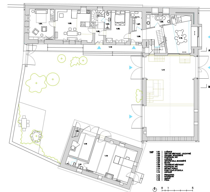
Půdorys usedlosti, nahore koupelna v bývalém výmíneku

Součástí usedlosti je menší dům v jižní části dvora, kdysi výmínek. Dnes slouží jako pracovna se samostatnou koupelnou, v jeho druhé části zůstala garáž. Jsou tu i schody do patra, které se časem využije jako ložnice pro hosty. •